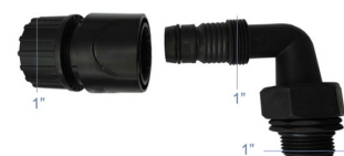
OC-M-02 Złącze kolano 1" + szybkozłączce